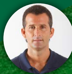
AUTOR DEL CURSO IGOR OCA PULIDO