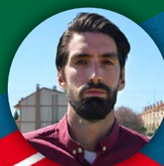
AUTOR DEL CURSO ROBERTO PEDROVIEJO