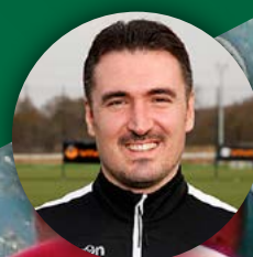
AUTOR DEL CURSO DAVID SERRANO RODRÍGUEZ